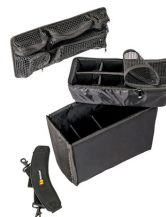
1435 Set di divisori imbottiti