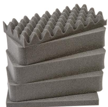
1431 5 pz. set ricambio schiuma