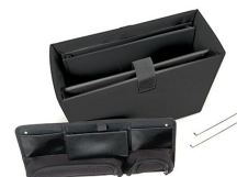
1436 Office Divider Kit