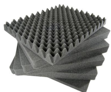
1461 6 pz. set ricambio schiuma