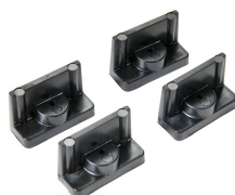
1507 Supporti veloci - set di 4