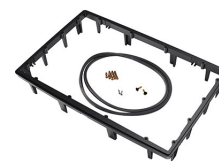
1490PF Telaio del pannello per applicazioni speciali