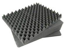
1491 3 pz. set ricambio schiuma