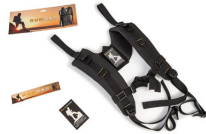
RucPac-normal Conversione zaino RucPac standard Hardcase