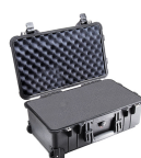
1510WF With Foam