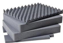
1561 4 pz. set ricambio schiuma