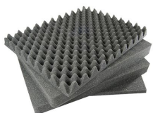
1771 4 pz. set ricambio schiuma