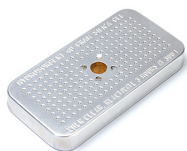
1500D Gel di silice essicante