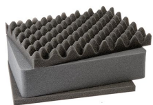
1451 3 pz. set ricambio schiuma