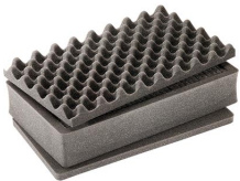
1485AirFS 3 pz. set ricambio schiuma