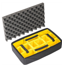
1485AirDS Set di divisori imbottiti