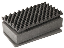
1525AirFS 3 pz. set ricambio schiuma