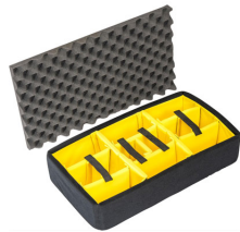
1555AirDS Set di divisori imbottiti